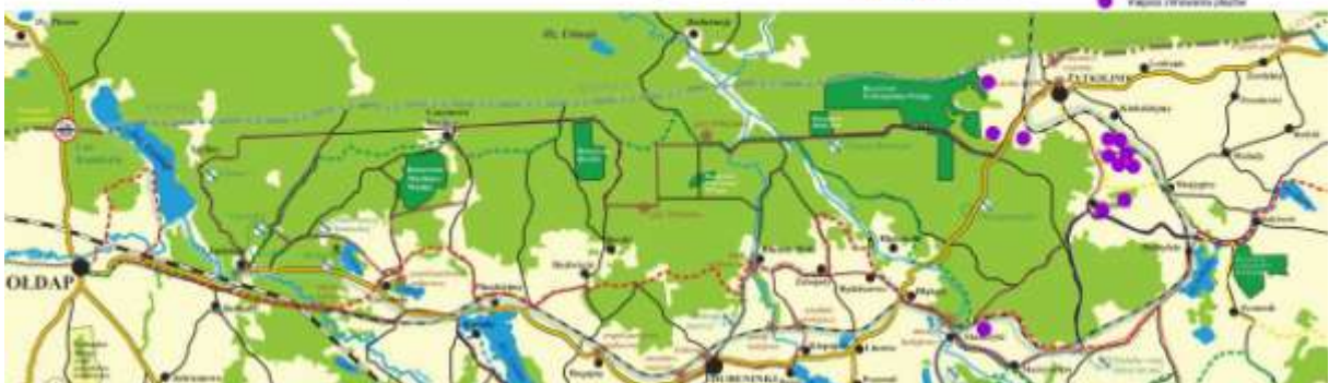
Mapka 2. Lokalizacja miejsc zimowania płazów