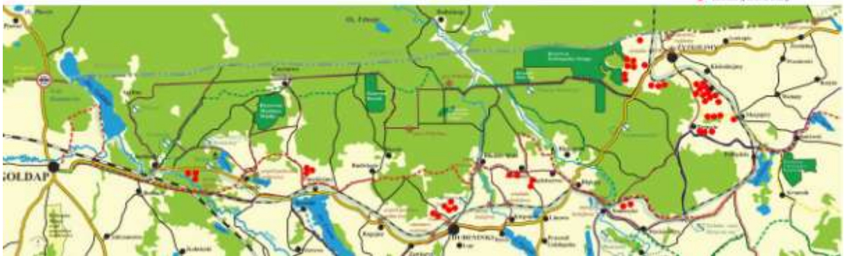
Mapka 1. Lokalizacja odtworzonych zbiorników wodnych